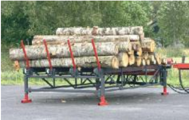
Palax Mega – robuster Holzauflegebock für große Stämme

Zu den Merkmalen gehören ein Stufenschieber und ein hydraulischer Vorschubtisch mit Kettenantrieb. Der Auflagebock ist mit vier 4 m langen Kettenbalken versehen. Die Ketten können vor- oder rückwärts laufen. Kapazität: ca. 10–12 m 3