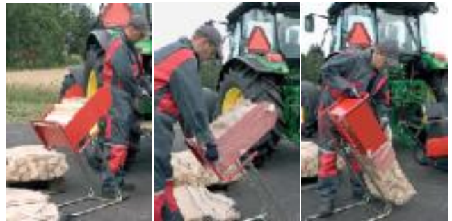
Die Beutelfüllhilfen Palax Packer und Motti erleichtern das Füllen von Beuteln

Die Holzsplitter in den Behälter legen, Beutel darüber ziehen, kippen und zubinden. Die Beutel können dann auf eine Palette gesetzt werden. Auf eine Europalette (0,8x1,2 m) passen 25 Beutel mit je 35 l Inhalt = ca. 0,88 Raummeter Brennholz. Auf eine finnische Standardpalette (1x1,2 m) passen 30 Beutel = ca. 1,05 Raummeter.