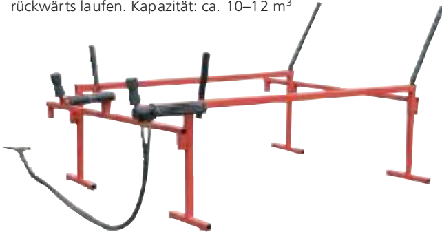
Leichter Holzauflegebock Palax Log

Zu den Merkmalen gehören ein Stufenschieber und ein hydraulischer Vorschubtisch mit Kettenantrieb. Der Auflagebock ist mit vier 4 m langen Kettenbalken versehen. Die Ketten können vor- oder rückwärts laufen. Kapazität: ca. 10–12 m 3